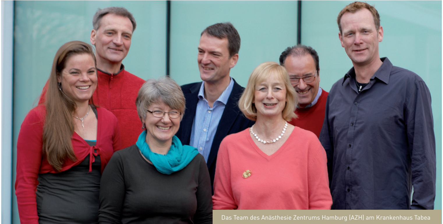
Das Team des Anästhesie Zentrums Hamburg (AZH) am Krankenhaus Tabea